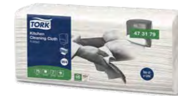
Torchon pour cuisine Tork Réf. art. 37135 • 41,5 x 35,5 cm

Convient pour une utilisation avec des solvants, désinfectants et produits de nettoyage