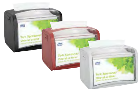
Distributeur sur table Réf. art. 22627 Réf. art. 22628 Réf. art. 22629