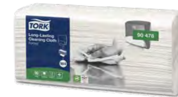
Tork Chiffons de Nettoyage Longue Durée Réf. art. 4994.2 • 41,5 x 35,5 cm