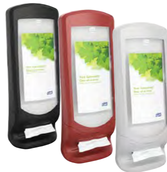
Distributeur sur pied/au mur Réf. art. 22633 Réf. art. 22634 Réf. art. 22635