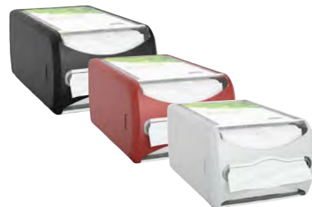
Distributeur de comptoir Réf. art. 22630 Réf. art. 22631 Réf. art. 22632