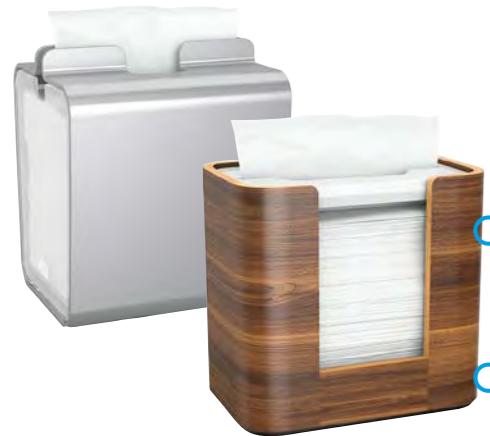
Distributeurs sur table/comptoirs Réf. art. 23961 Réf. art. 23959

Tork Xpressnap® vous permettent de proposer une expérience plus rapide et efficace lorsque hygiène et rapidité sont primordiales. La distribution feuille par feuille vous aide à contrôler la consommation et les coûts.